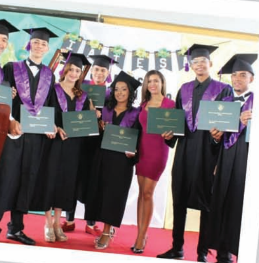
Agronómico Técnico Salesiano